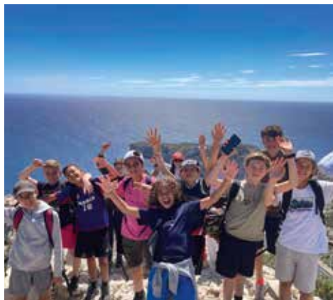
Les ados du Point Jeunes dans les Calanques

Enfin, ces vacances se sont terminées dans une ambiance chaleureuse et conviviale autour d'un barbecue partagé.