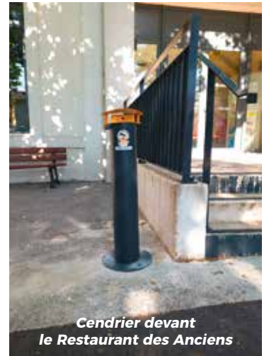
Cendrier devant le Restaurant des Anciens

Les mégots collectés sur l'ensemble des dix points de collecte seront ensuite recyclés grâce au partenariat avec l'organisme RECYCLOP, spécialisé dans la valorisation de ces déchets spécifiques. Avec une capacité totale de 75 litres, ce nouveau maillage communal permettra de renforcer la propreté des espaces publics tout en favorisant une gestion plus responsable des déchets de cigarettes.