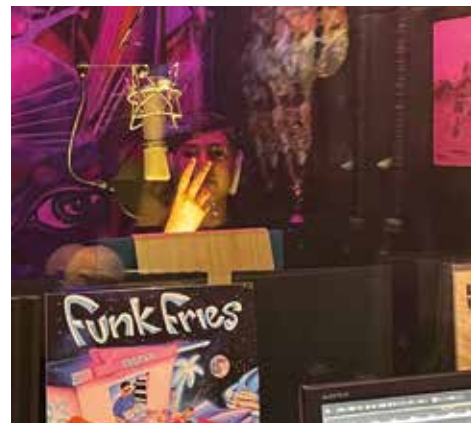
Dans le studio d'enregistrement chez Akino