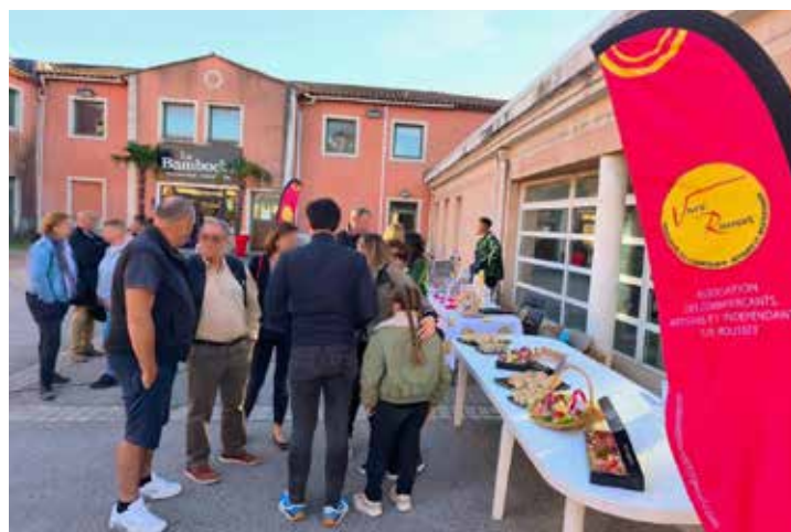
After work de la Saint-Patrick