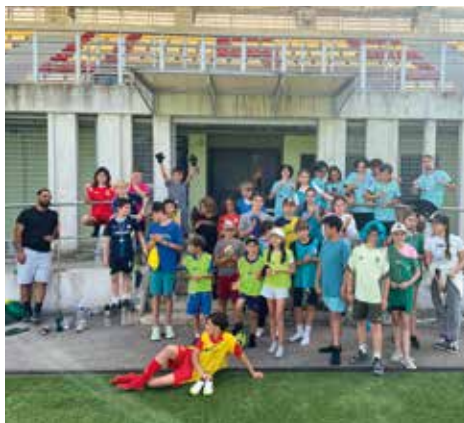
Tournoi de foot inter Point Jeunes