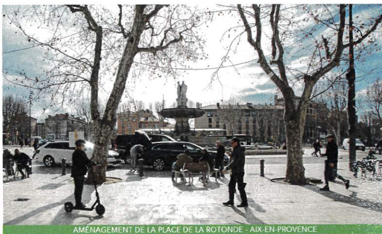
AMÉNAGEMENT DE LA PLACE DE LA ROTONDE - AIX-EN-PROVENCE