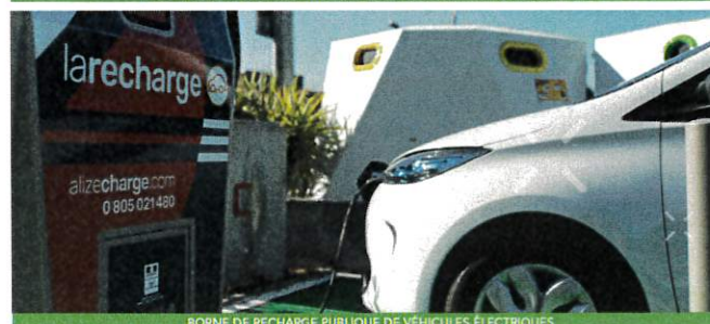
BORNE DE RECHARGE PUBLIQUE DE VÉHICULES ÉLECTRIQUES