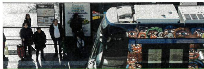
LE TRAMWAY D'AUBAGNE UNE LIGNE DU RÉSEAU EXPRESS MÉTROPOLITAIN