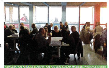
CONCERTATION PUBLIQUE ÉLABORATION PDU 2020-2030 AIX-MARSEILLE-PROVENCE ATELIER

» Lancée en 2018, le processus s'est achevé en octobre 2019.