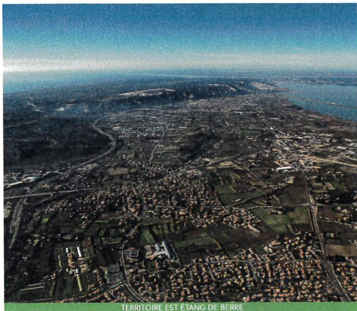
TERRITOIRE EST ÉTANG DE BERRE