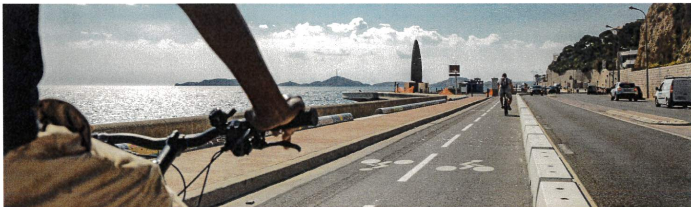
PISTE CYCLABLE CORNICHE KENNEDY - MARSEILLE